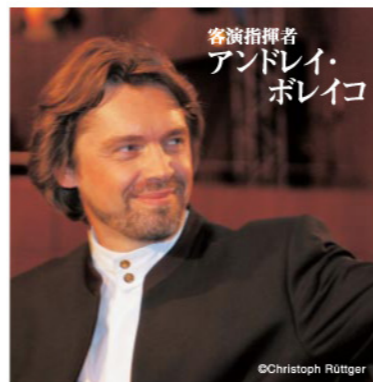
客演指揮者 アンドレイ・ボレイコ