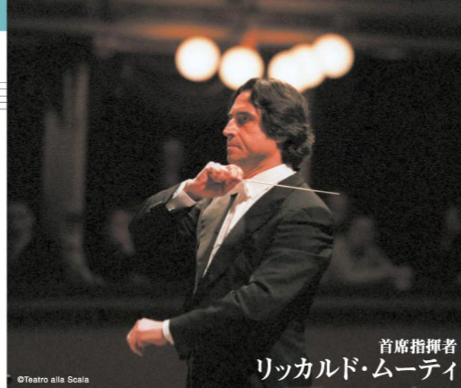
首席指揮者 リカルド・ムーティ

そして最終週の客演指揮者はロシアのアンドレイ・ボレイコ。日本ではNHK交響楽団などと共演しましたが、ジョルダンとともにPMF初登場です。札幌・名古屋・大阪でそのレパートリーを披露する彼ですが、今回は満を持してのオール・ロシア・プログラム。聴く者に神秘的な印象を与えるスクリャーピンの交響曲第4番「法悦の詩」など、色彩豊かなロシア音楽を得意とする彼の手腕に注目です。ソリストには、同じくロシア出身で、1990年チャイコフスキー国際コンクール優勝者でもあるボリス・ベレゾフスキーを迎え、ロマン派のピアノ協奏曲の頂点ともいわれるラフマニノフのピアノ協奏曲第3番を演奏します。