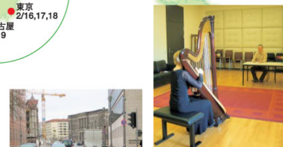
※本人の了解を得た上で本書の様子を再現しています。

1月22日(月)のケルン(ドイツ)からスタートしたオーケストラコースのPMFアカデミーオーディション。今年はケルン、サンフランシスコ、シンガポールを加え、世界21都市で約2か月にわたり実施しています。より多くの音楽を志す若者に挑戦してもらうため、受験料は無料。国や言語が異なっても、夏の札幌を目指す若者の真剣なまなざしは変わりません。合格発表は3月下旬を予定しています。