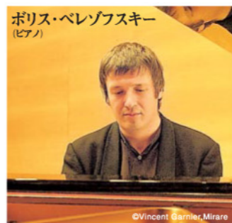
ボリス・ベレゾフスキー (ピアノ)