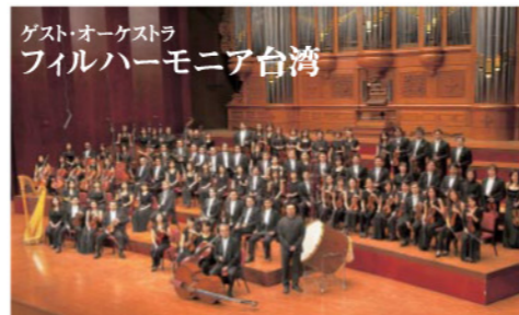
ゲスト・オーケストラ フィルハーモニア台湾

PMFオーケストラ・レジデント・コンダクターとして長年活躍してきたウェンピン・チエンが音楽監督をつとめる、フィルハーモニア台湾が初来日。ゲスト・オーケストラとしてアジアのオーケストラを紹介するのは今回が初めてです。近年めざましい発展を続けるアジアのエネルギッシュなサウンドにご期待ください。ソリストとして迎える“情熱のヴァイオリニスト”ジョセフ・リンによるブラームスのヴァイオリン協奏曲も必聴です!