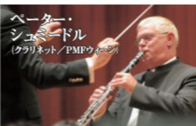
ペーター・シュミードル (クラリネット/PMFウィーン)