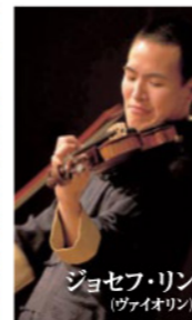
ジョセフ・リン (ヴァイオリン)