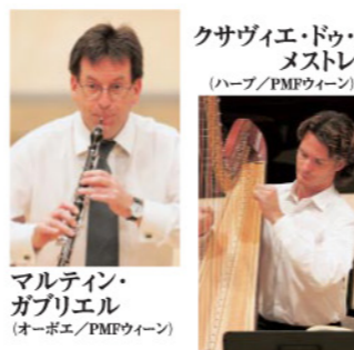
クサヴィエ・ドゥ・メストレ (ハープ/PMFウィーン)