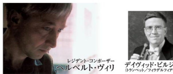
レジデント・コンポーザー ヘルベルト・ヴィリ

コンポジションコースでは、毎年世界で活躍する作曲家を招いていますが、今年はオーストリアからヘルベルト・ヴィリを迎えます。“自分自身の内なる心に耳を傾けると、そこには必ず音楽が聞こえてくる”という言葉に表されるように、彼の作品には内面と真摯に向き合う姿勢が感じられます。PMF2007では、フィリップ・ジョルダン指揮によるPMFオーケストラ演奏会でクラリネット協奏曲を取り上げるほか(独奏:ペーター・シュミードル)、PMFウェルカムコンサートではフルート協奏曲(独奏:ヴォルフガング・シュルツ)、ピクニックコンサートではトランペット協奏曲(独奏:デイヴィッド・ビルジャー)、パシフィック・サウンディングでは彼の室内楽作品をお楽しみいただけます。