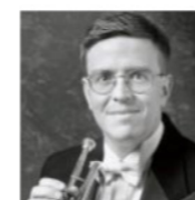
デイヴィッド・ビルジャー (トランペット/フィラデルフィア管弦楽団)