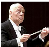
ハイティンク 首席指揮者 2003