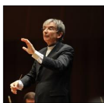
ティルソン・トーマス 芸術監督 1990-2000, 09