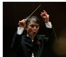
メルクル 首席指揮者 2005, 08, 13