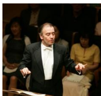
ゲルギエフ 首席指揮者 2004, 06