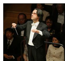
ムーティ 首席指揮者 2007