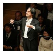
R. ムーティ 首席指揮者 2007