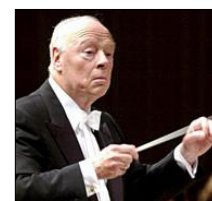
B. ハイティンク 首席指揮者 2003