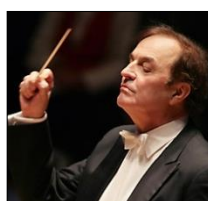
C. デュトワ 芸術監督 2000-02