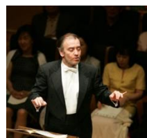
V. ゲルギエフ 首席指揮者 2004, 06