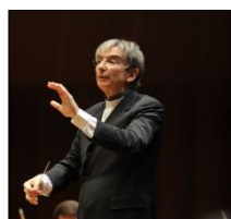
M. ティルソン・トーマス 芸術監督 1990-2000, 09