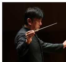
佐渡裕 25 th Anniversary 2014 特別指揮者