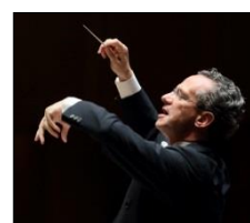
F. レイジ 芸術監督 2004, 08, 10-12