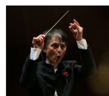
準・メルクル 首席指揮者 2005, 08, 13