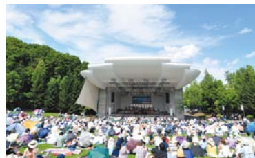
ピクニックコンサート 清涼感あふれるクラシック音楽の祭典 (札幌芸術の森・野外ステージ)