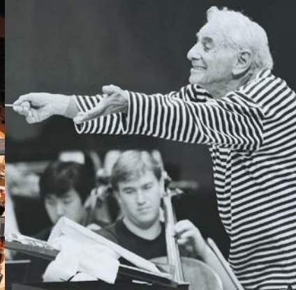
レナード・バーンスタイン