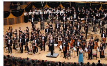
PMF GALAコンサート 華やかでゴージャスなエンターテインメント (札幌コンサートホールKitara)