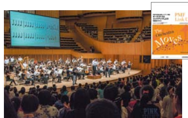
PMFリンクアップ・コンサート PMFオーケストラと小学6年生が夢の共演 (札幌コンサートホールKitara)