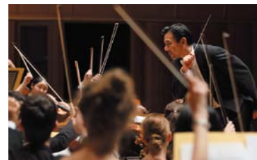
PMFオーケストラ演奏会 約100人の仲間が心をひとつに演奏 (札幌コンサートホールKitara)